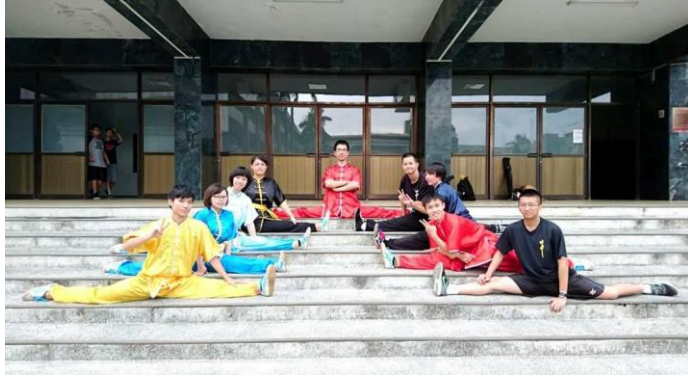
社團聯展的好夥伴